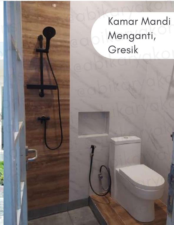
Kamar Mandi Menganti, Gresik