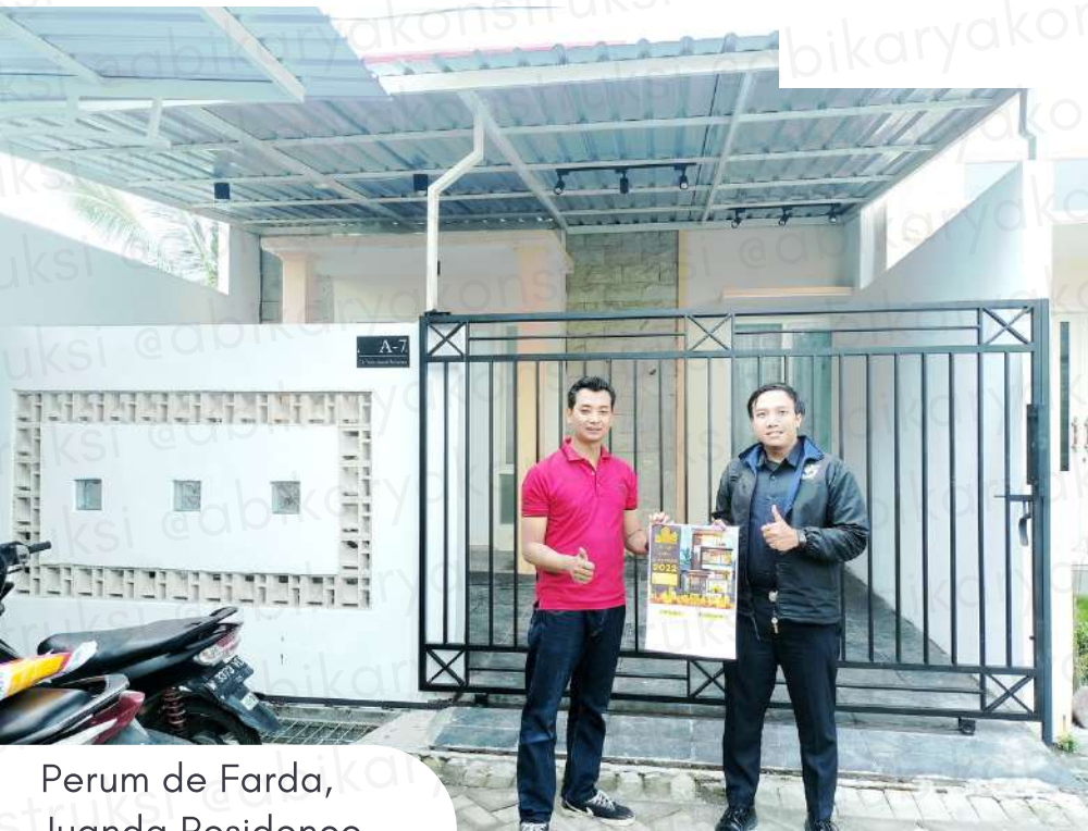
Perum de Farda, Juanda Residence, Sidoarjo