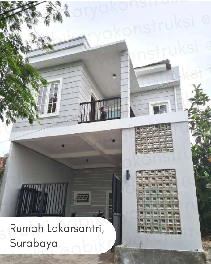
Rumah Lakarsantri, Surabaya

Pondok Pesantren Gayung Kebonsari, Surabaya