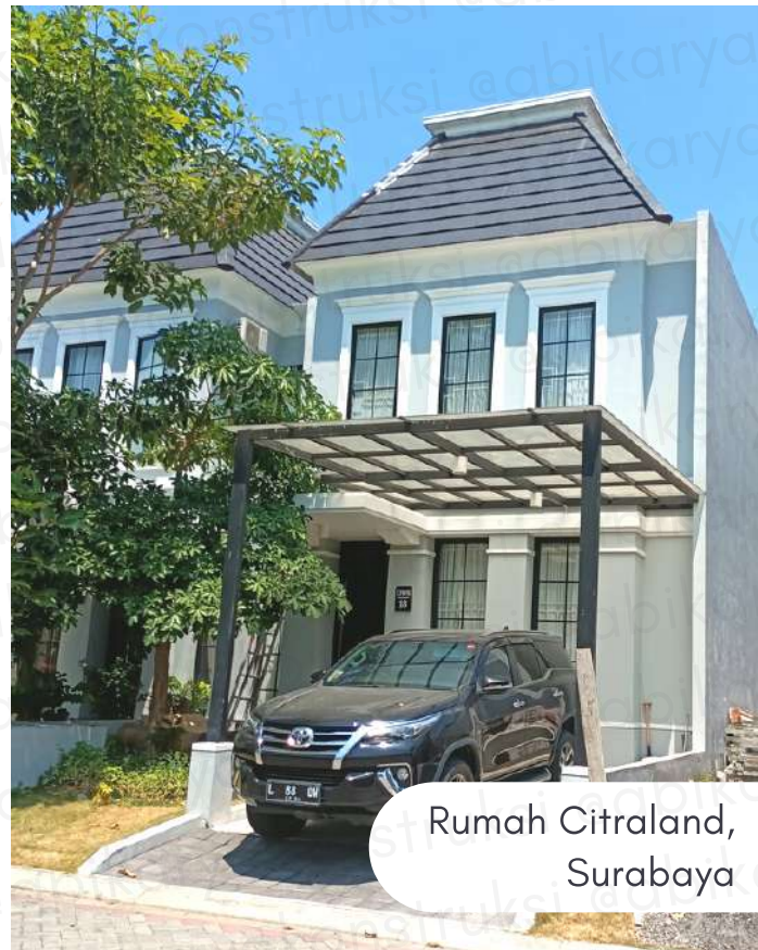
Rumah Citraland, Surabaya